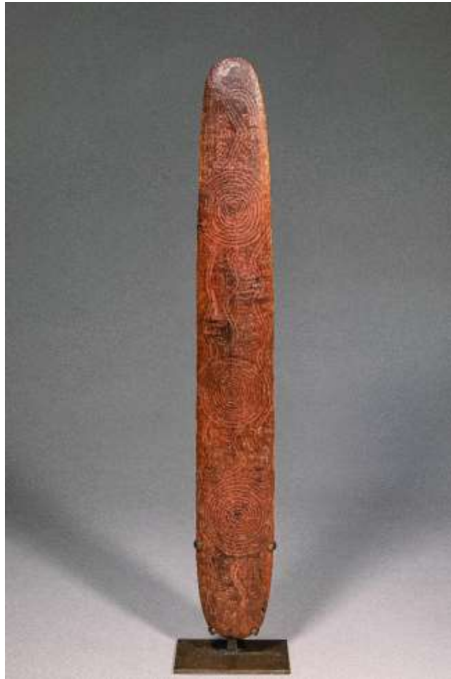
Churinga Australie, Culture Aborigène Bois gravé Haut. : 49 cm