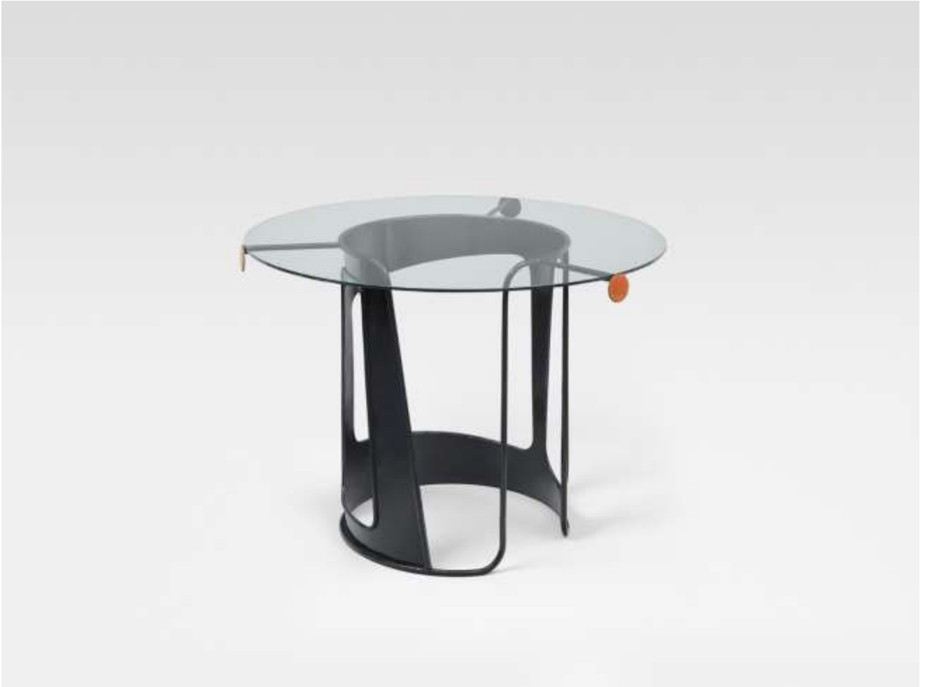
Mathieu MATEGOT (1910-2001) Table modèle Kyoto, vers 1954 Tôle laquée et verre Haut. : 72 cm - Diam. : 99 cm

Provenance : Collection particulière depuis l'origine