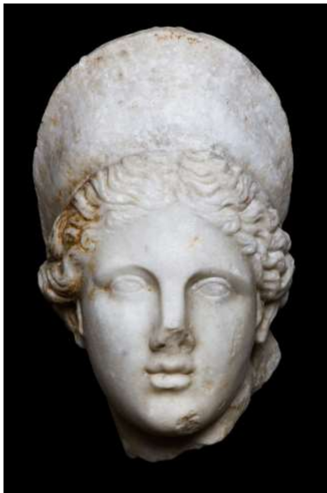
Tête d'Aphrodite au diadème Marbre Art romain, I er -II e siècle ap. J.-C. Haut. : 36,5 cm