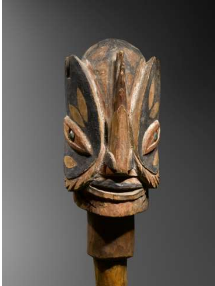
Tête culturelle Marada

Bois ( Alstonia scholaris ), opercules ( Turbo petholatus ), fibres, résine ( Parinarium laurinum ) et pigments