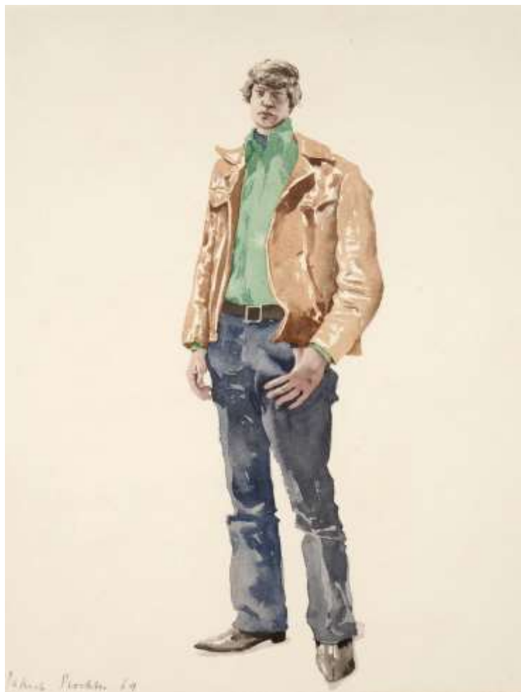
Patrick PROCKTOR (1936-2003) Mick Jagger , 1969 Aquarelle sur papier Signé et daté en bas à gauche 51 x 37 cm