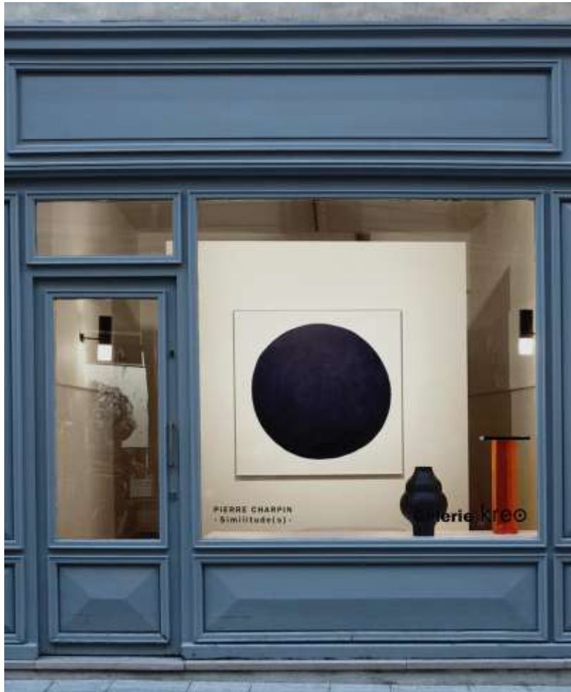
Pierre CHARPIN (né en 1962)

Pour cette 7 e exposition monographique à la galerie, comme souvent dans son travail, il a privilégié des créations par séries, conçues à partir de formes géométriques élémentaires qui se composent et s'imbriquent, dans des matières et textures très contrastées et une gamme de couleurs éclatantes.