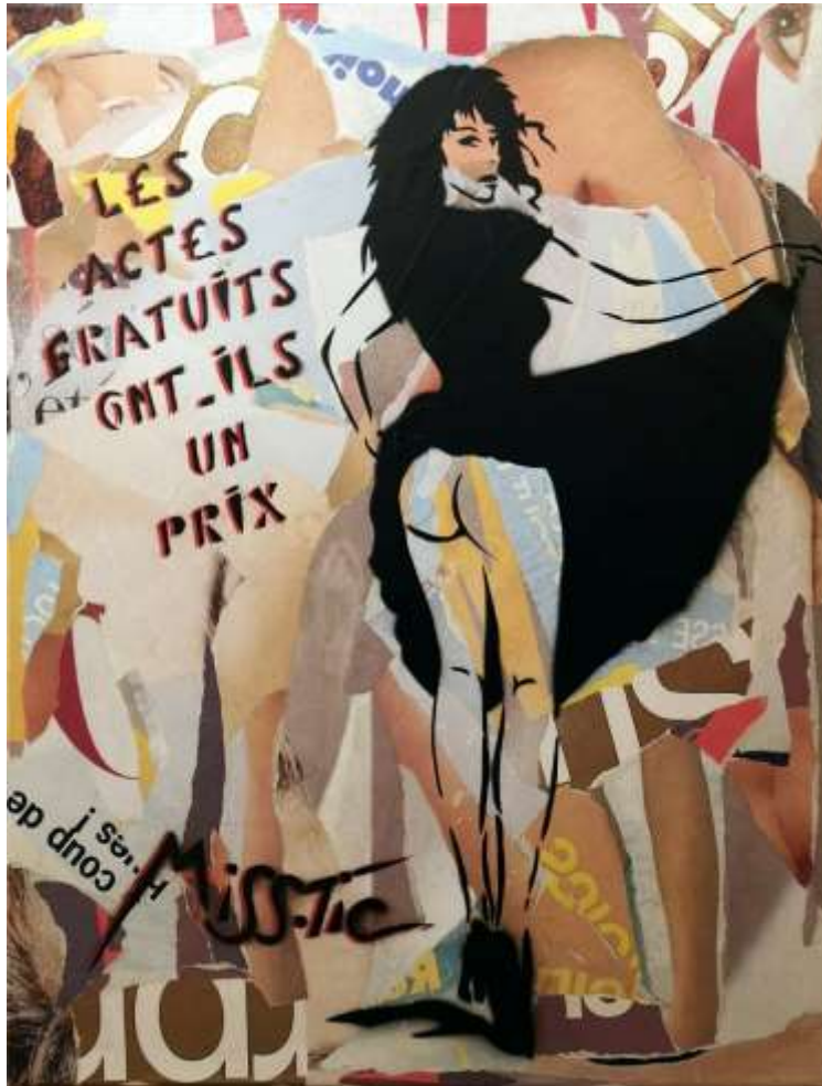
MISS.TIC (née en 1956) Les actes gratuits ont-ils un prix , 2006 Encre aérosol sur fragment d'affiche 92 x 73 cm