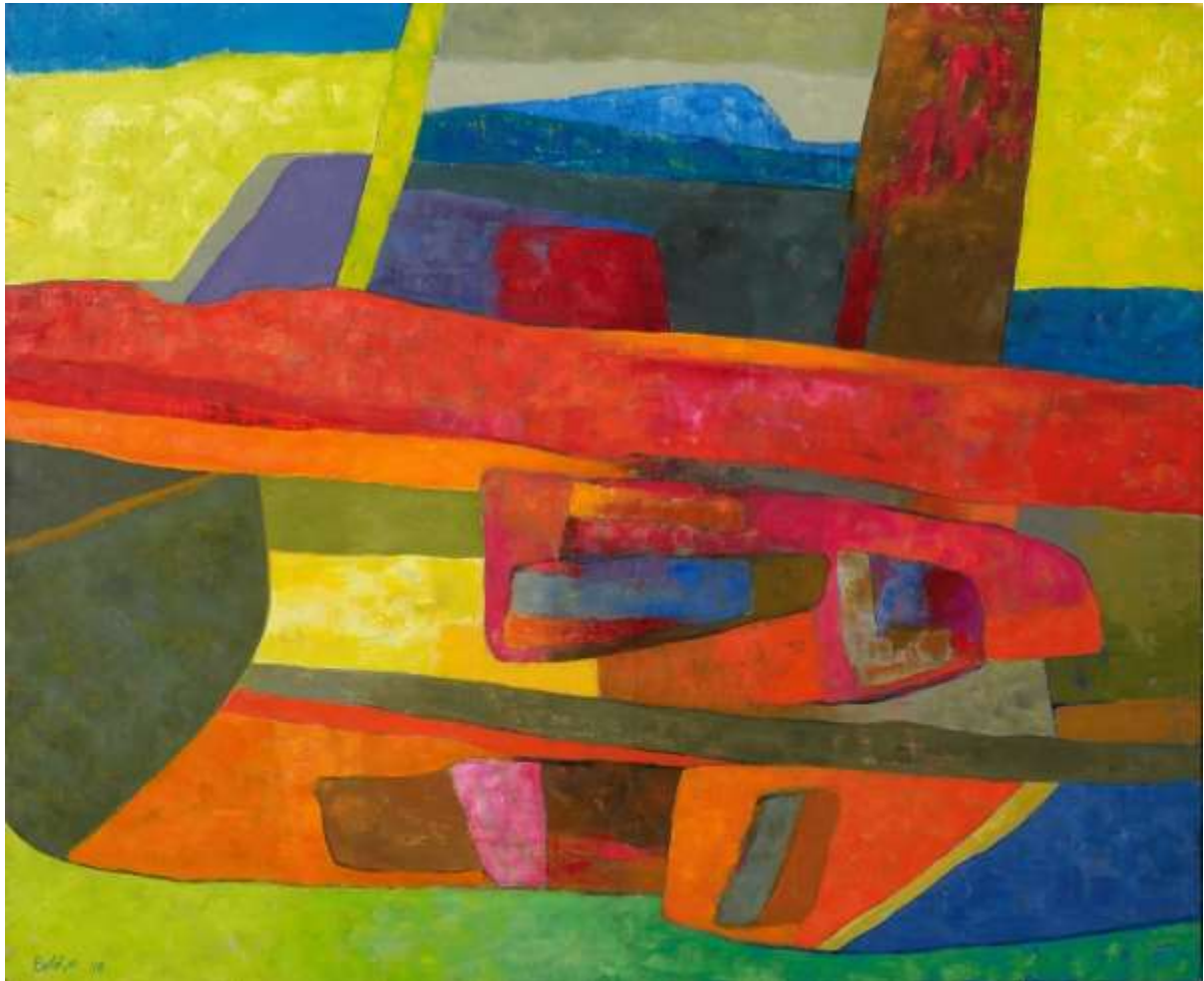
Maurice ESTEVE (1904-2001) Langolem , 1978 Huile sur toile Signé et daté en bas à gauche - Titré, signé et daté au dos 60 x 73 cm