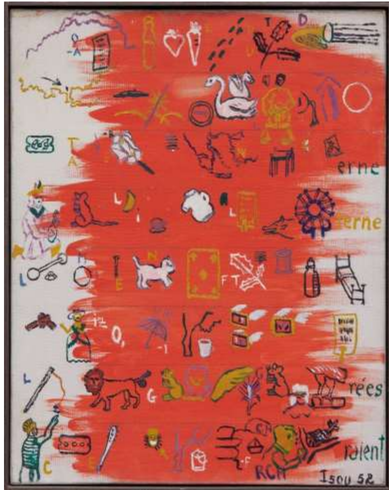
Isidore ISOU (1925-2007) Les nombres : N°33 , 1952 Huile sur toile Signé et daté en bas à droite 65 x 54 cm