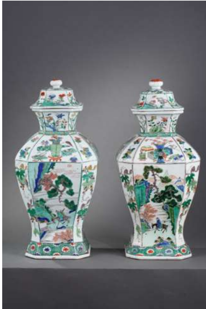
Paire de vases en porcelaine de la famille verte Chine, époque Kangxi (1662-1722) Haut. : 51 cm