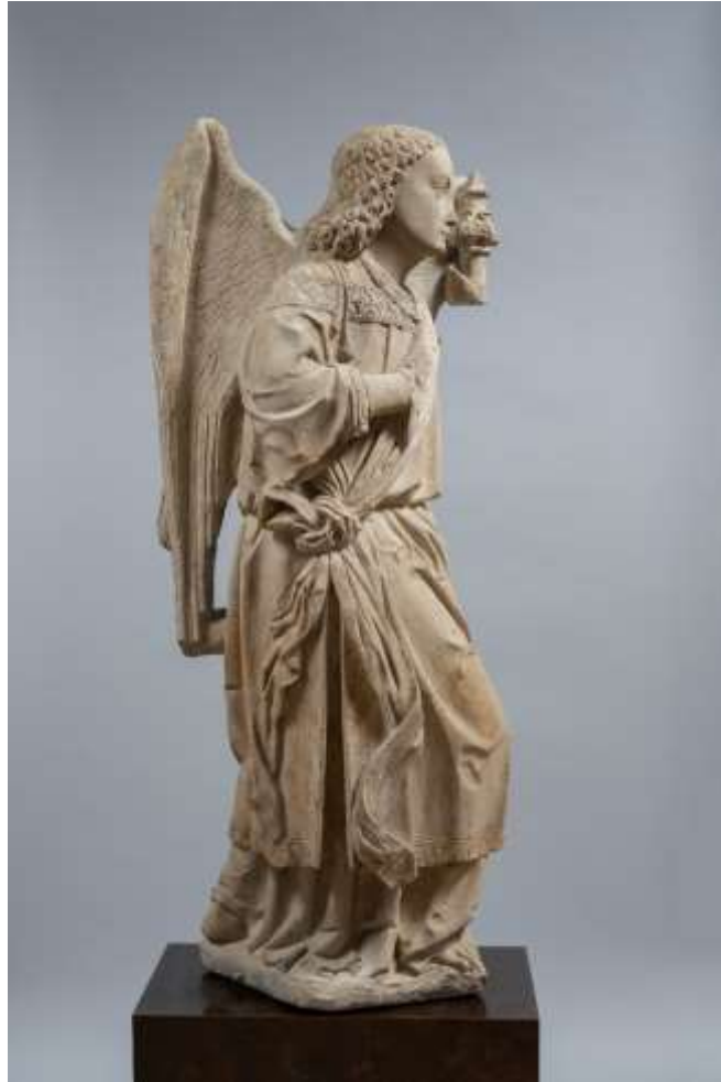
Ange de l'Annonciation Craie de Normandie Haute-Normandie Premier quart du XVI e siècle Haut. 112 cm - Larg. 52 cm

GOTHIQUE - DE L'ART DES CATHEDRALES AU SPÄTGOTIK ALLEMAND