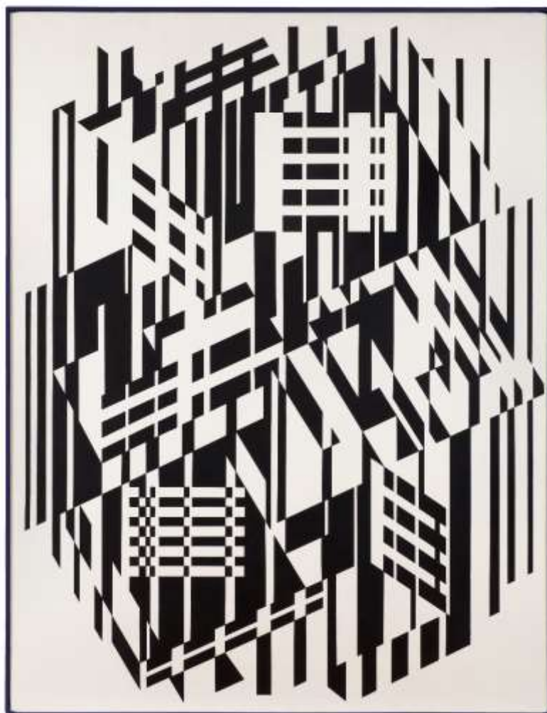
Victor VASARELY (1906-1997) AFA-NB2 , 1964 Peinture sur toile Signé au bas au centre Contresigné, titré, daté au dos 170 x 130 cm

REFLEXIONS EN NOIR ET BLANC SUR L'ABSTRACTION EUROPEENNE DES ANNEES 50-60