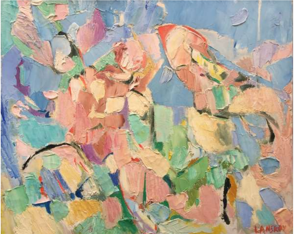
André LANSKOY (1902-1976) A la recherche des navires , 1961 Huile sur toile Signé en bas à droite 60 x 72 cm

Provenance : Galerie Louis Carré Galerie Raymond Dreyfus