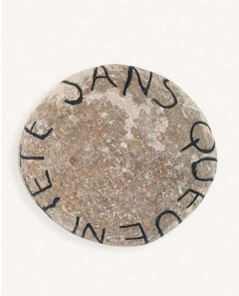
Jean DUPUY (Né en 1925) Sans queue ni tête , 1988 Pierre gravée et acrylique 11 x 25 cm