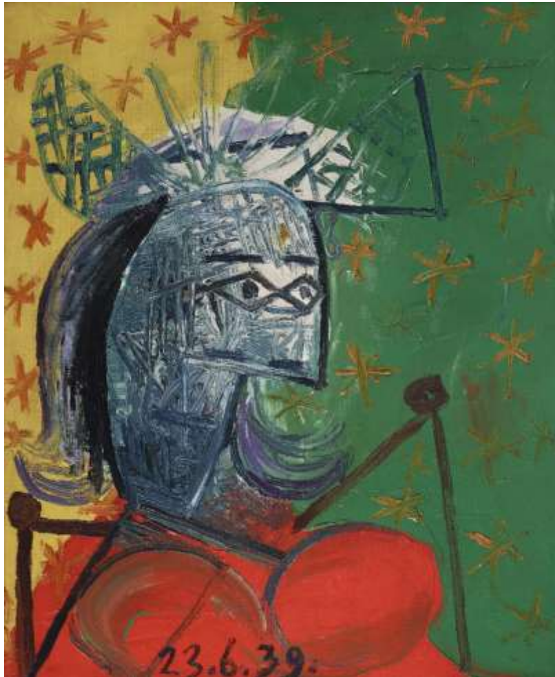
Pablo PICASSO (1881-1973) Femme assise au chapeau , 1939 Huile sur toile 61 x 50 cm