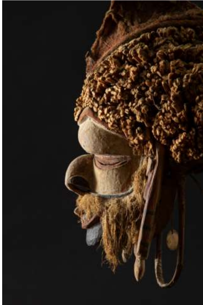
Masque Malagan Nord de la Nouvelle-Irlande 19 e siècle Haut. : 52 cm

Collecté in situ par la Mission Hiltrup, Allemagne Ex Vente Etude Champin, Lombrail & Gautier, Enghien, 23 juin 1984, lot 35 Acquis par Georges Goldfayn auprès d'Alain Schoffel en 1984