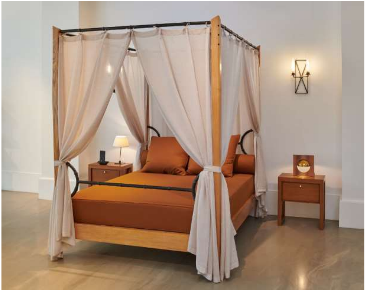
Lit de Jacques ADNET (1900-1984) Chevets et appliques de Jean ROYERE (1902-1981)