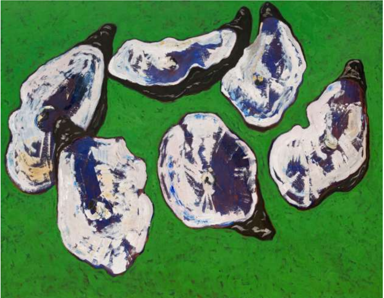
Guy de MALHERBE (né en 1958) Reliefs : six huitres dans le vert, 2020 Huile sur toile 114 x 146 cm