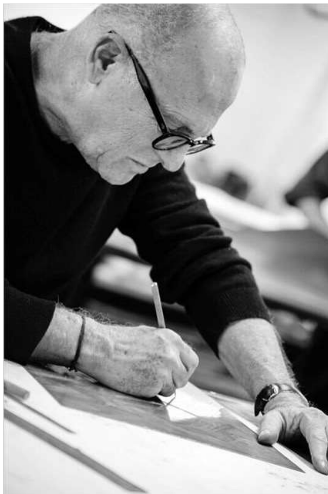
Ra'anan LEVY (né en 1954)

Composée d'un ensemble de petits portraits et d'un grand format, cette exposition proposera de plonger dans un intense jeu de regards, de dialogues et d'observation. Peints sur des petits formats, les portraits et autoportraits jouent le jeu de l'intimité, du tableau-cadeau ou du tableau-souvenir, nous faisant pénétrer dans la vie même de l'artiste et de ses proches.