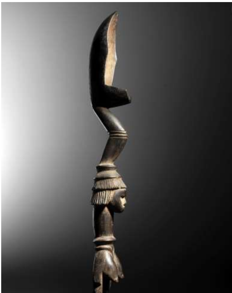
Cuillère Bidjogo Guinée-Bissau, Archipel des Bissagos Bois Circa XIX e - XX e siècle Haut. : 56 cm

Provenance : Ancienne collection Maine Durieu (1941-2015), Paris Collection particulière, Paris