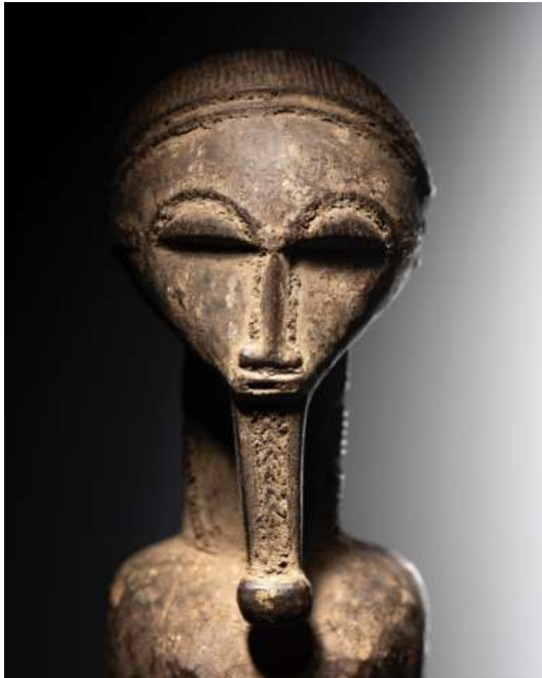
Sculpture Baoulé République de Côte d'Ivoire Bois Haut. : 36 cm